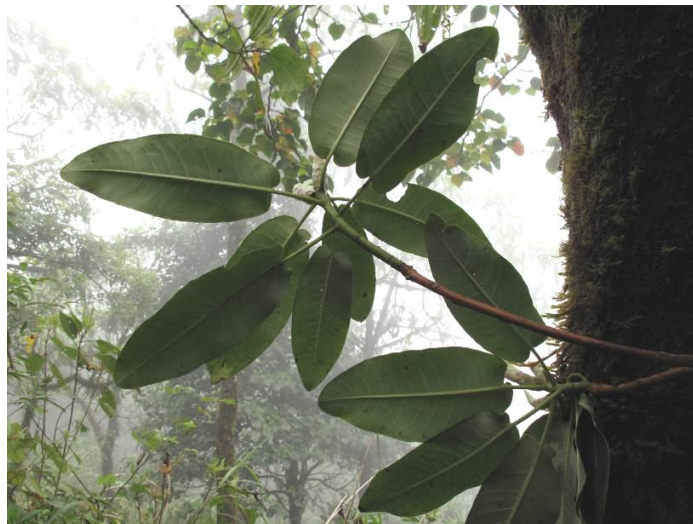
R. serotinum aff.

Cohabitent du R. moulmainense , R. excellens et R. emarginatum . Un peu plus bas, dans un vallon transverse, on découvre de grands exemplaires de R. serotinum . Notre guide confirme la floraison tardive et le caractère parfumé des floraisons de ce dernier mais il renonce à poursuivre vers Suoi Doi et nous rejoignons un village dans les rizières pour y passer la nuit. Surprise ! La maîtresse de maison nous a préparé des frites à l'ail ! Autant vous dire que le plat a été rapidement englouti.