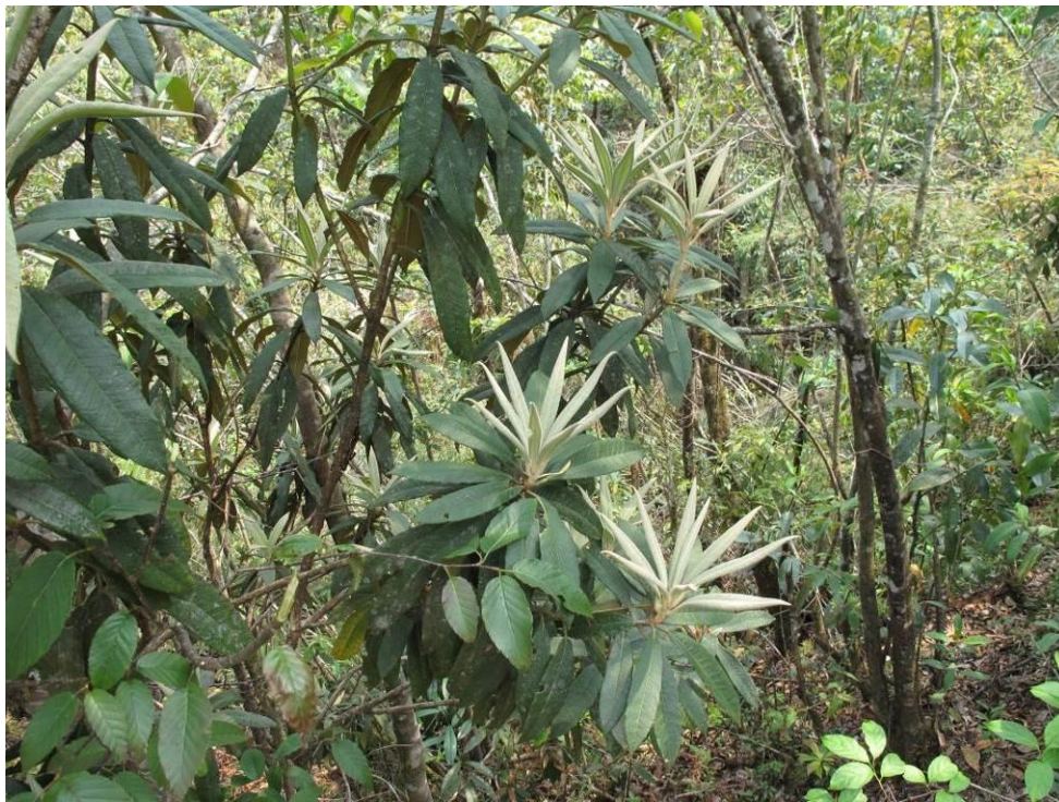
R. arboreum ssp. delavayi aff. ( fansipanense ?)

On repère également R. arboreum ssp. delavayi aff. ( fansipanense ?), introduit en 1992 par K. Rushforth, puis R. ovatum .