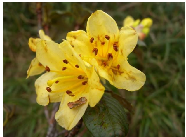
R. valentinioides aff.