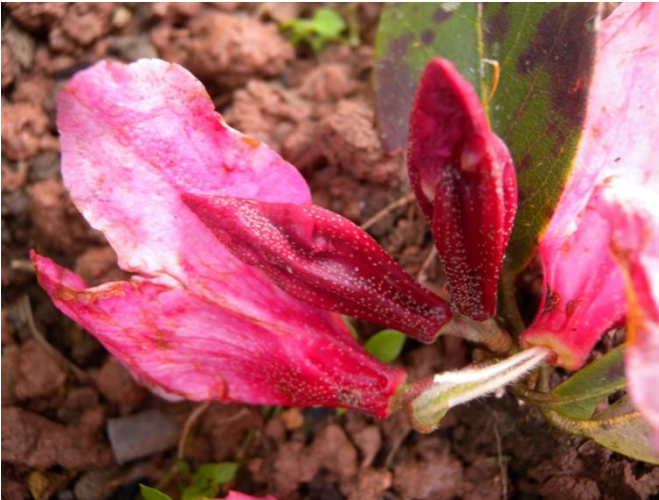
Maddenia rose vif